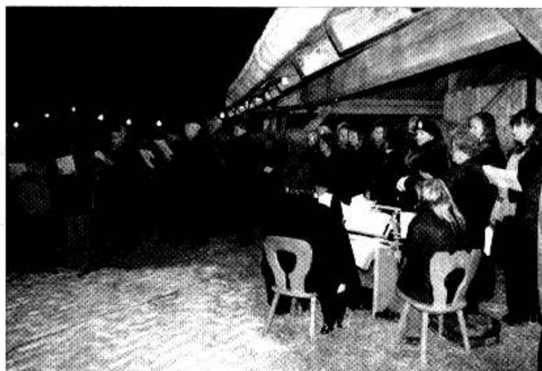
Der „Haidreisei-Chor“ aus Haidmühle (rechts) und der Wollaberger Männerchor brachten Lieder „auf die heilige Nacht zu“.